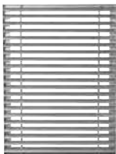
GFE - Liseré