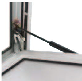
Vérins et contact intégré dans le profil