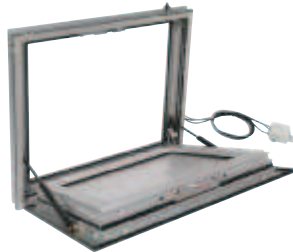
Ouvert, en position de sécurité