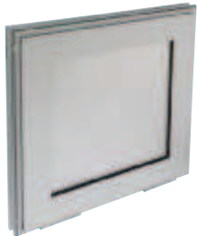
OXYTONE PANNEAU 2012 fermé, en position attente