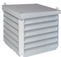
Édicule de toiture AP 639