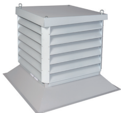
Édicule avec souche pour toit plat